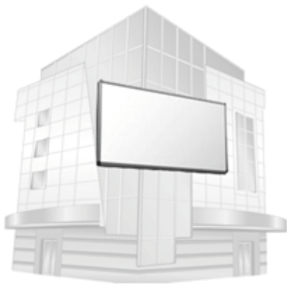
Видеостена на сграда